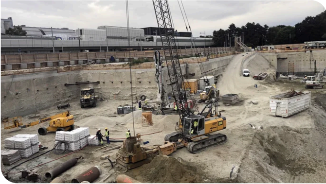
Die Tiefbrunnen für die Wasserhaltung wurden mittels Großlochbohrung hergestellt.

Der Grundwasserspiegel außerhalb der Baugrubenumschließung liegt ca. 8 m über der tiefsten Aushubsohle. Um den Aushub und den späteren Kellerausbau trocken ausführen zu können, wurde das Grundwasser mit umfangreichen Wasserhaltungsmaßnahmen abgesenkt. Die Wasserhaltung erfolgte innerhalb der Baugrube mit 18 Entnahmebrunnen und außerhalb der Baugrube mit 10 Versickerungsbrunnen. Hergestellt wurden diese als Großlochbohrung mit 900 mm Durchmesser bis in eine Tiefe von 25 m unter Urgelände. Um ein Absenken des Grundwassers innerhalb der fertigen Baugrube überhaupt zu ermöglichen, erfolgte – typisch für Wiener Baugruben – eine dichte Einbindung der Verbauwand in den Wiener Tegel. Dabei handelt es sich um einen Schluff-Ton mit sehr geringer Wasserdurchlässigkeit.