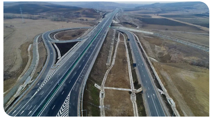
Einblick in die umfangreichen Entwässerungsmaßnahmen auf dem Projekt.

Eine funktionierende Entwässerung ist für die Langlebigkeit einer Straße von großer Bedeutung. Deshalb wurden insgesamt 100 km an Oberflächen-Entwässerungsgerinnen, 5,6 km Längsdrainagen, 43.000 m 3 an Steinschüttung für die Regulierung der querenden Bäche und 119 Ölabscheider gebaut.