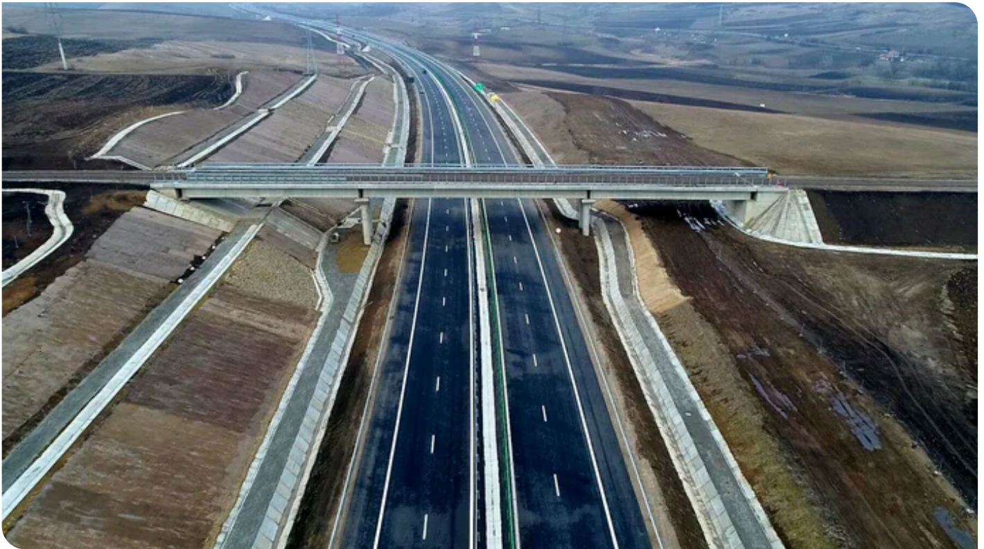
One of the bridges over the newly-built motorway.