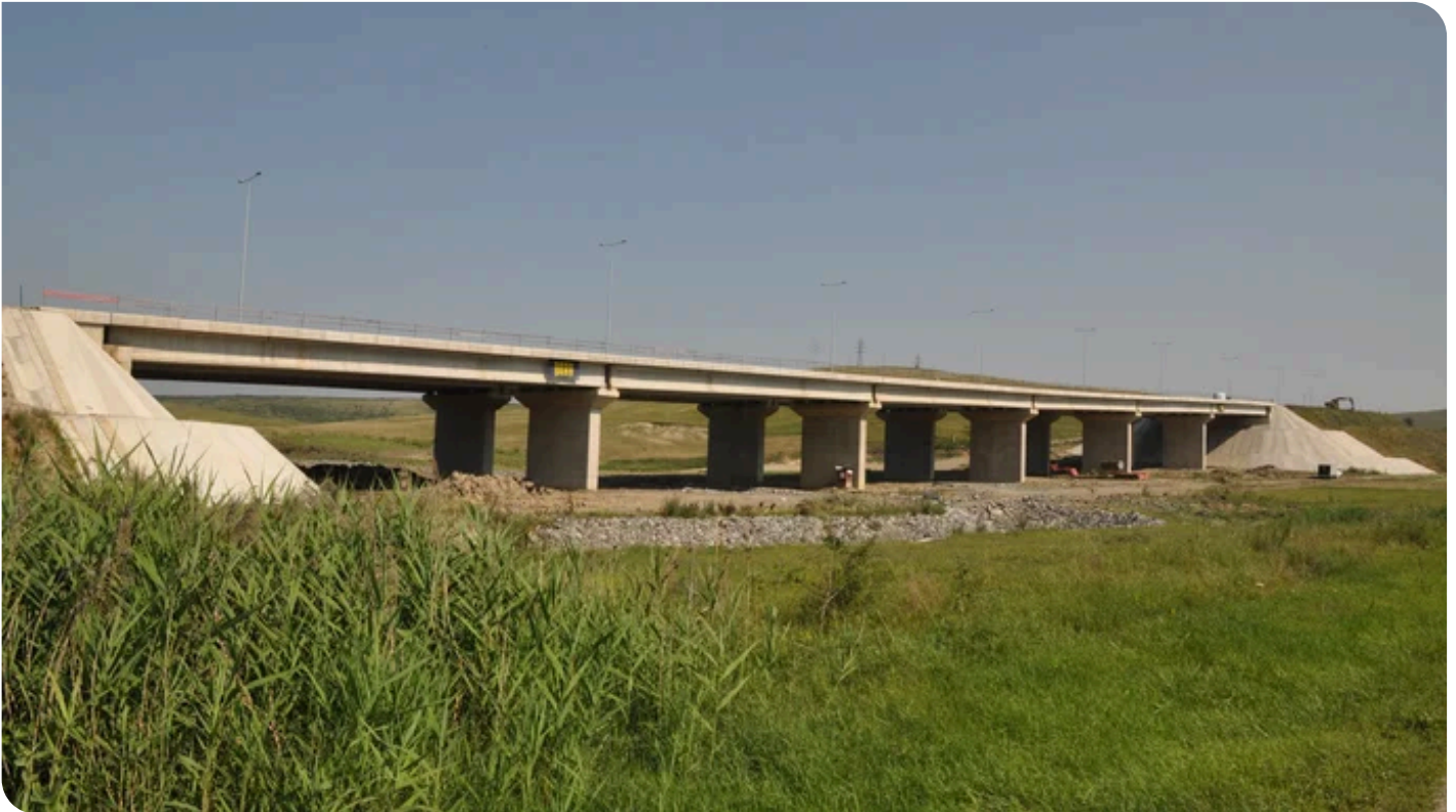
Die 255 m lange Autobahnbrücke im Sektor 5 ist die längste Brücke des Projekts.