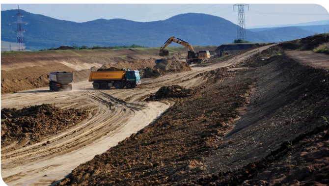
Ein 220 kV Strommast direkt in der Mitte der Autobahn musste umgelegt werden.

Eine zentrale Herausforderung bei Aufträgen dieser Art ist der Umgang mit den bestehenden Einbauten. In diesem Fall mussten Gas-, Wasser-, Elektrizitäts- und Telekommunikationsleitungen vor dem Start der Arbeiten geschützt oder umgelegt werden.